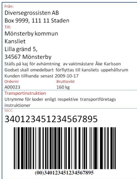
Figur 2: Transportetikett för köparens samdistributör och matchning av leveransavisering

Samdistributören använder transportinstruktionen som underlag sin transportplanering. Samdistributören levererar till köparens godsmottagare enligt förutbestämd rutt.