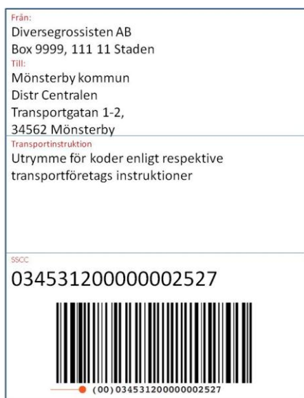
Figur 1: Transportörens transportetikett

Om leverantören anlitar en transportör för transport mellan leverantören och samdistributören ska transportören kräva att den sammanställda leveransen märks med transportetikett. För att hålla samman denna leverans kan transportören också kräva att transportetiketten är identifierad med SSCC. Samdistributören kan läsa av denna transportetikett innan den logistiska enheten bryts upp och respektive kolli fördelas till respektive rutt. Köparen övertar ansvaret för godset när samdistributören mottar leveransen. http://www.gs1.se/sv/Streckkoder/Transportmarkning/